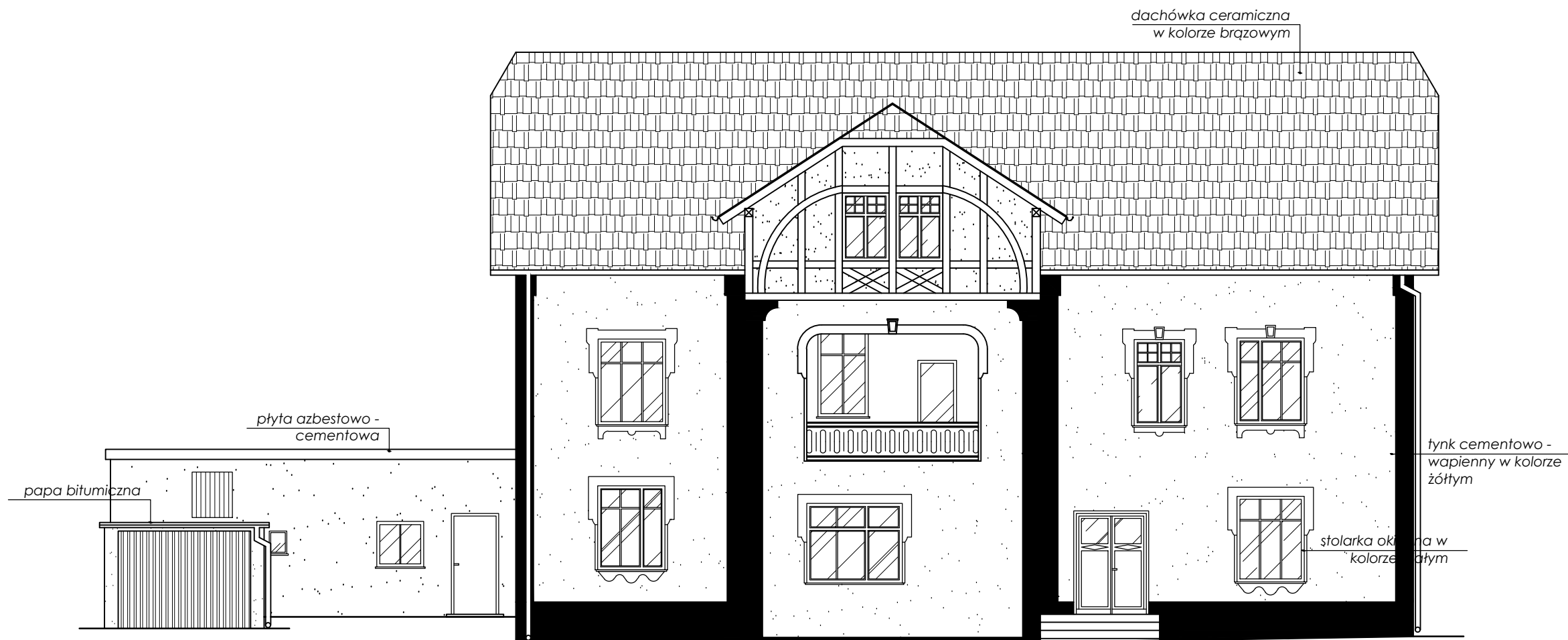
ELEWACJA WSCHODNIA skala 1:100